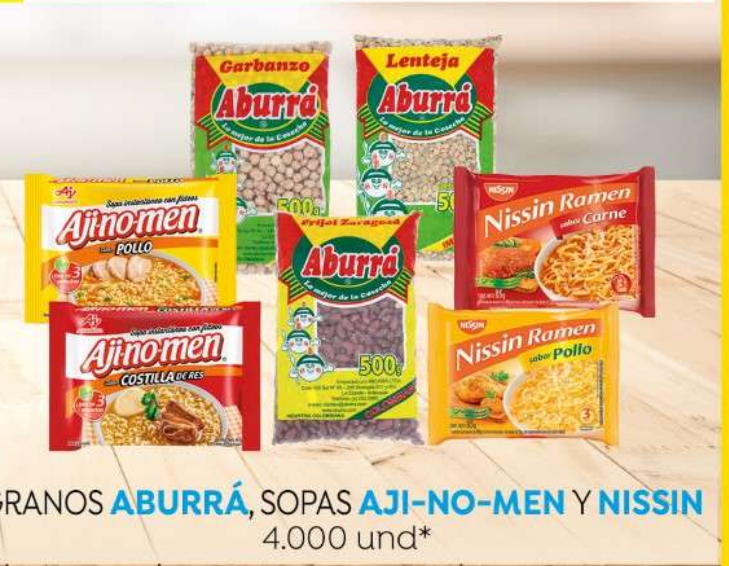
GRANOS ABURRÁ , SOPAS AJI-NO-MEN Y NISSIN 4.000 und*