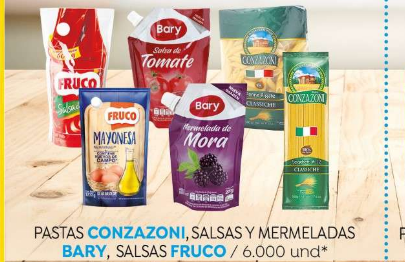
PASTAS CONZAZONI , SALSAS Y MERMELADAS BARY , SALSAS FRUCO / 6.000 und*