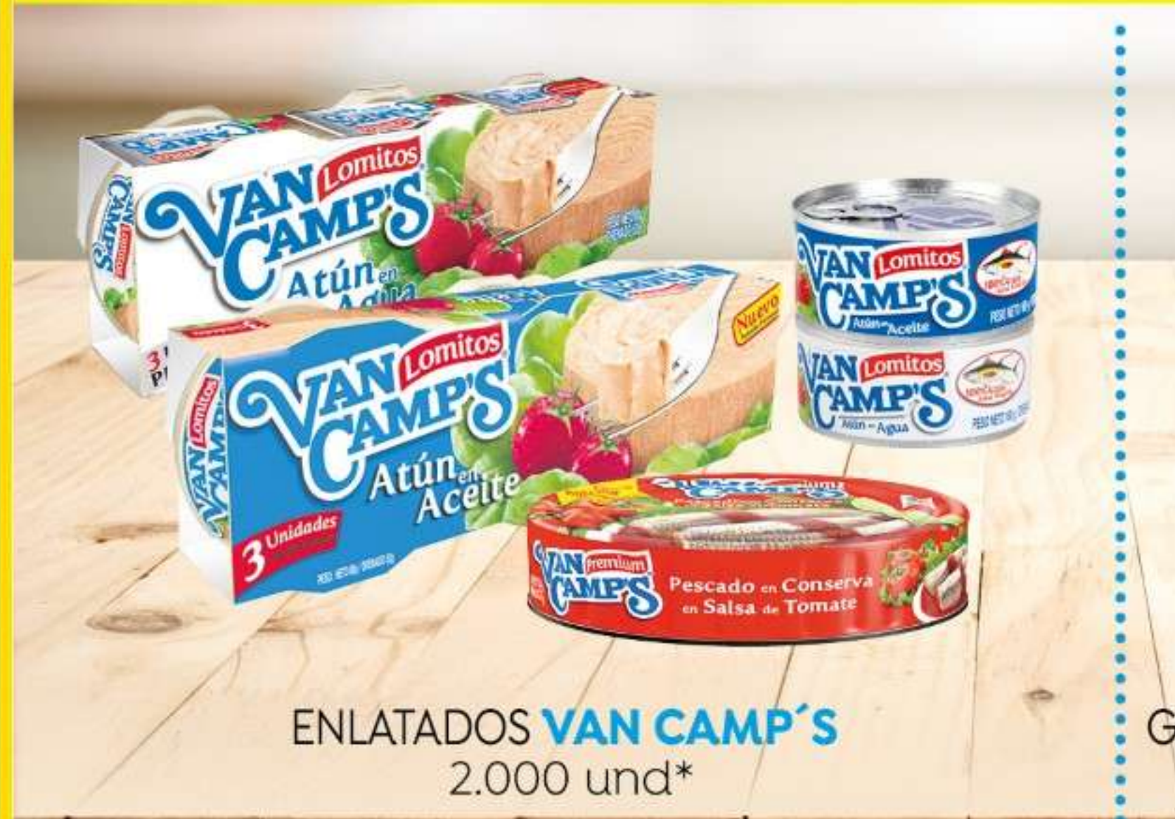
ENLATADOS VAN CAMP'S 2.000 und*