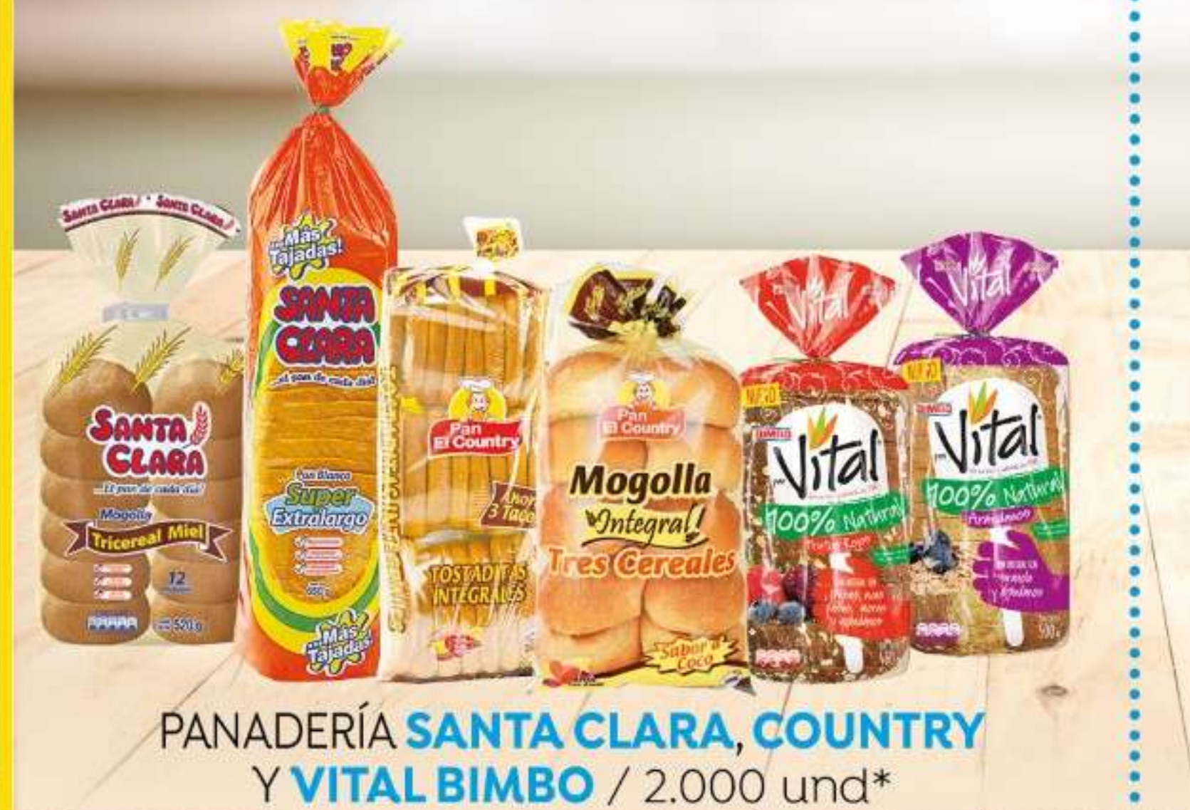
PANADERÍA SANTA CLARA , COUNTRY Y VITAL BIMBO / 2.000 und*