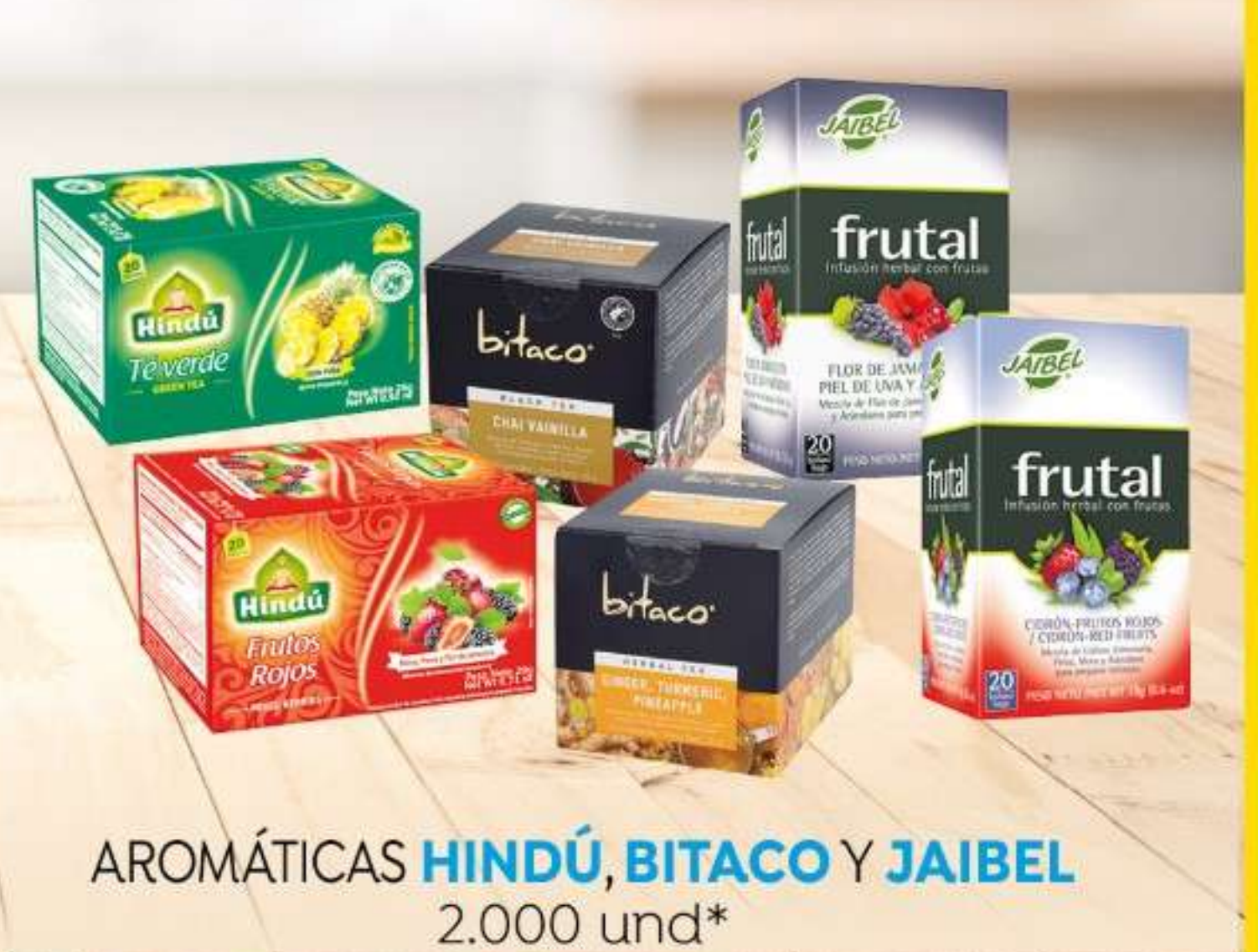
AROMÁTICAS HINDÚ , BITACO Y JAIBEL 2.000 und*