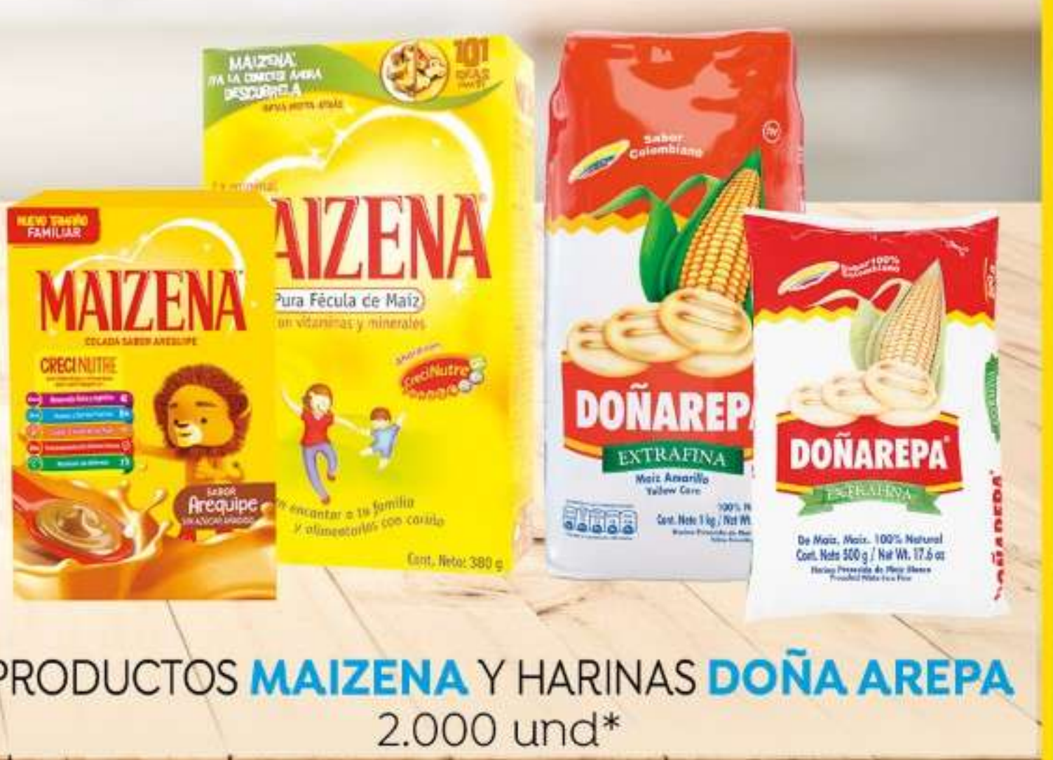
PRODUCTOS MAIZENA Y HARINAS DOÑA AREPA 2.000 und*